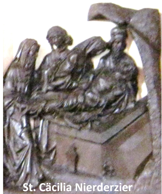
St. Cäcilia Niederzier