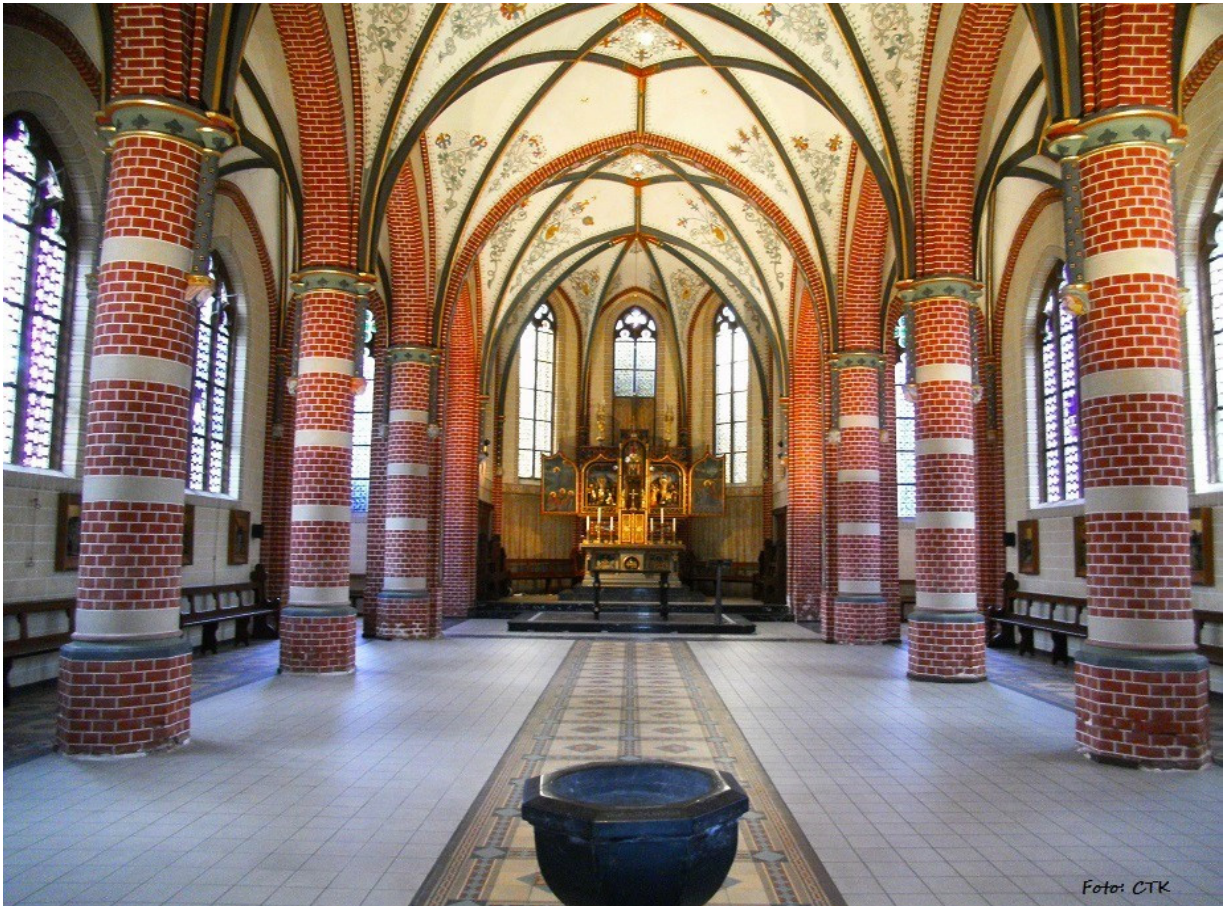
St. Sebastianuskirche – Innenraum 2016

Es wird um eine Spende als Kostenbeitrag für die Herstellung der Broschüre gebeten.